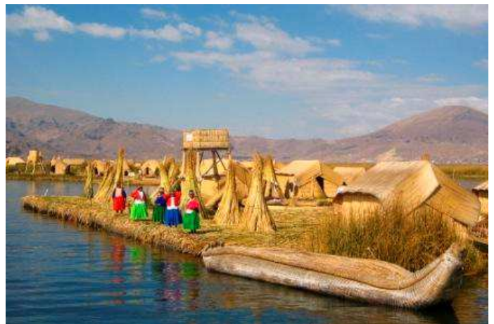
Islas Flotantes de los Uros, Titicaca, Perú