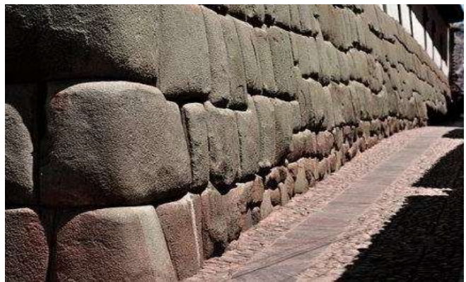
Parets de Cuzco