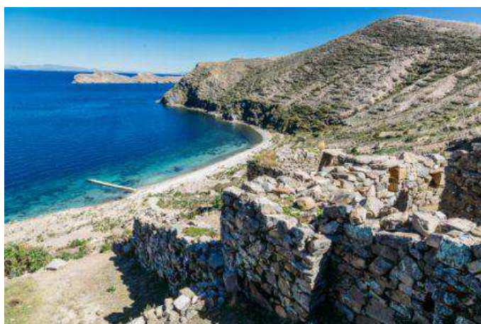
Isla del Sol