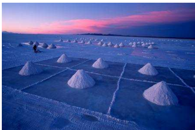
Gran Salar Uyuni