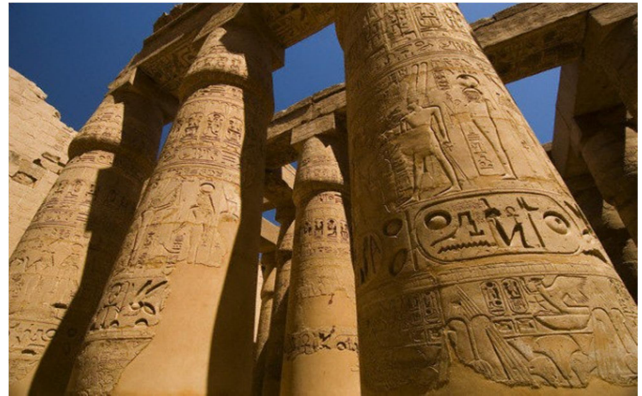
Templo de Karnak