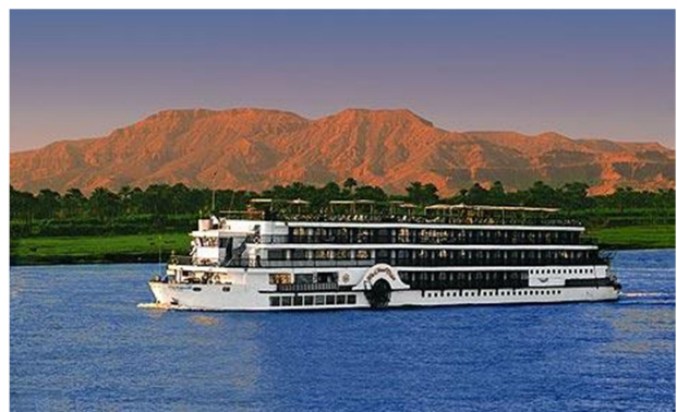
Crucero per el Nilo