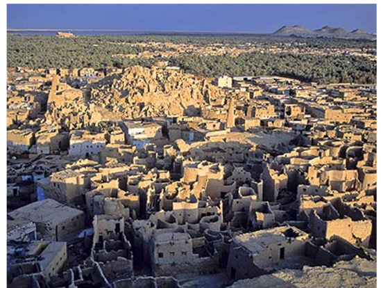
Oasis de Siwa