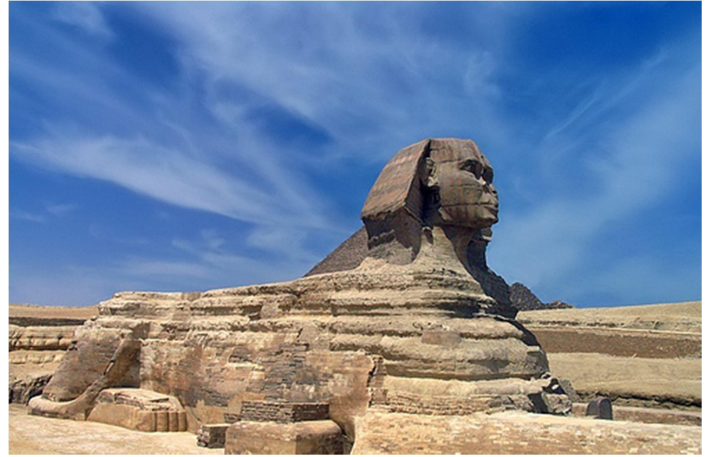
Esfinge de Gizah