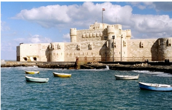
Alejandria- Fortaleza de Quitbay