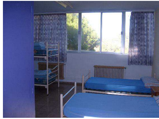
Alberg La Victòria, habitació múltiple