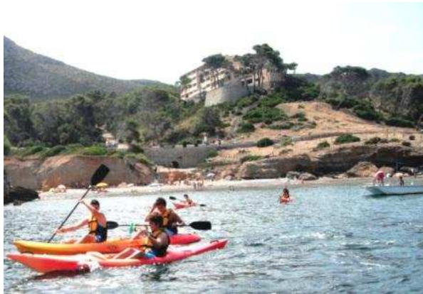
Piragüisme davant de l'alberg