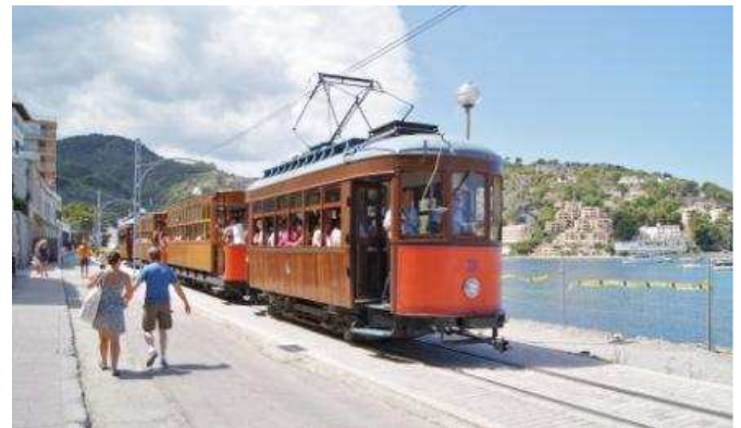
Antic tramvia de Sóller a Port de Sóller