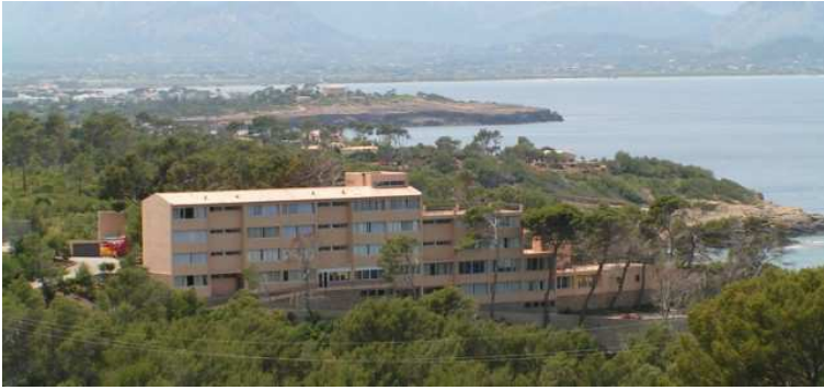
Alberg La Victòria i la badia d'Alcúdia