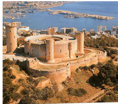
Castell de Bellver i Palma