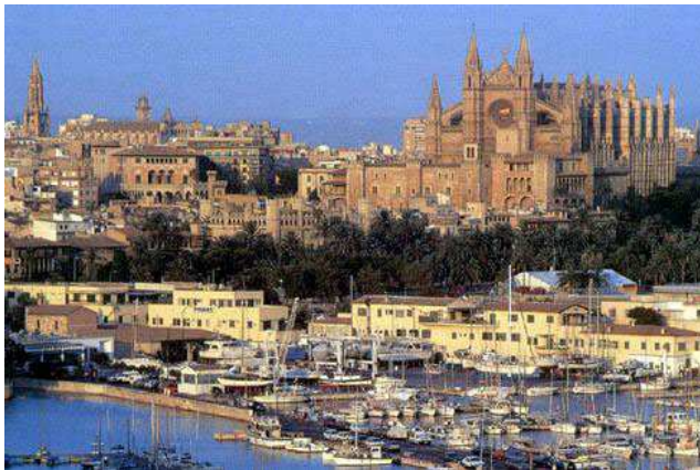
Palma de Mallorca, port i Catedral