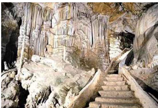
Coves de Campanet